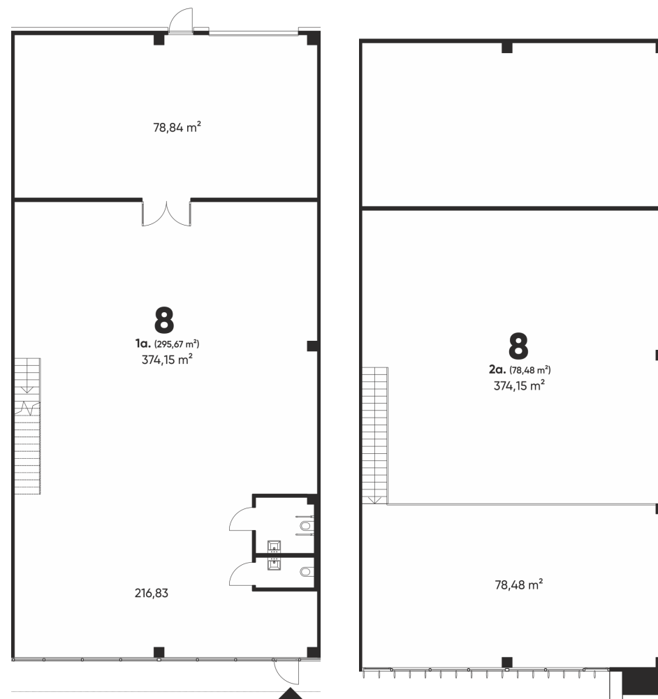
1 aukšto planas