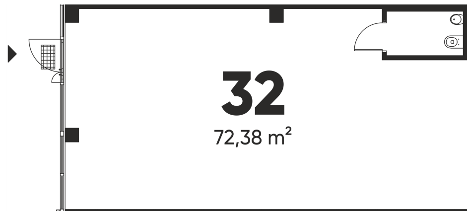
1 aukšto planas