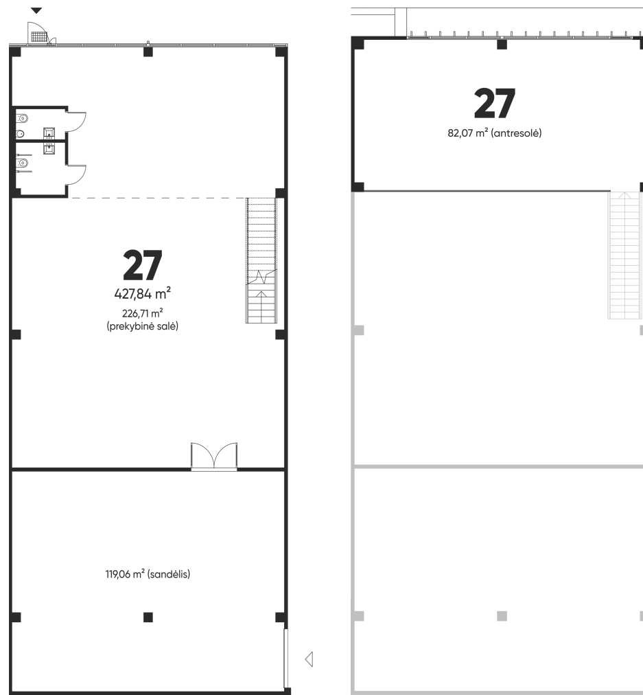
1 aukšto planas