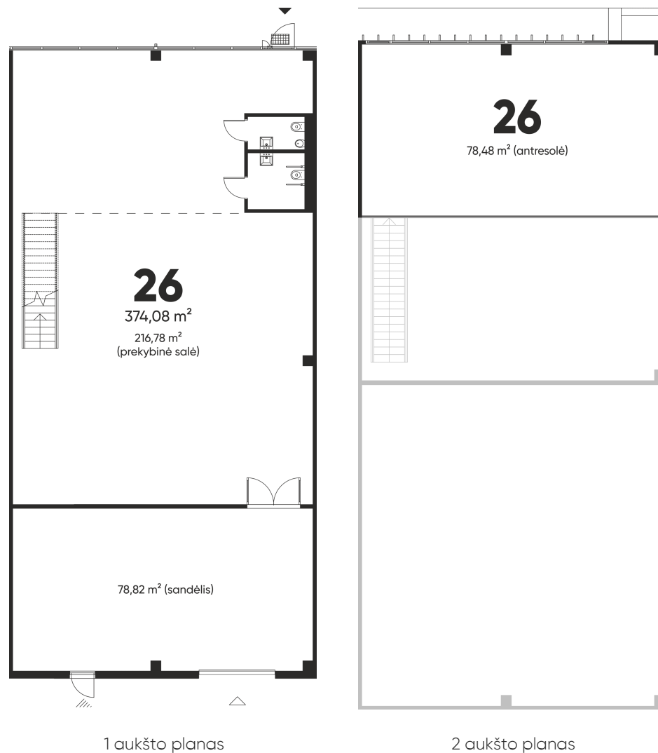
1 aukšto planas