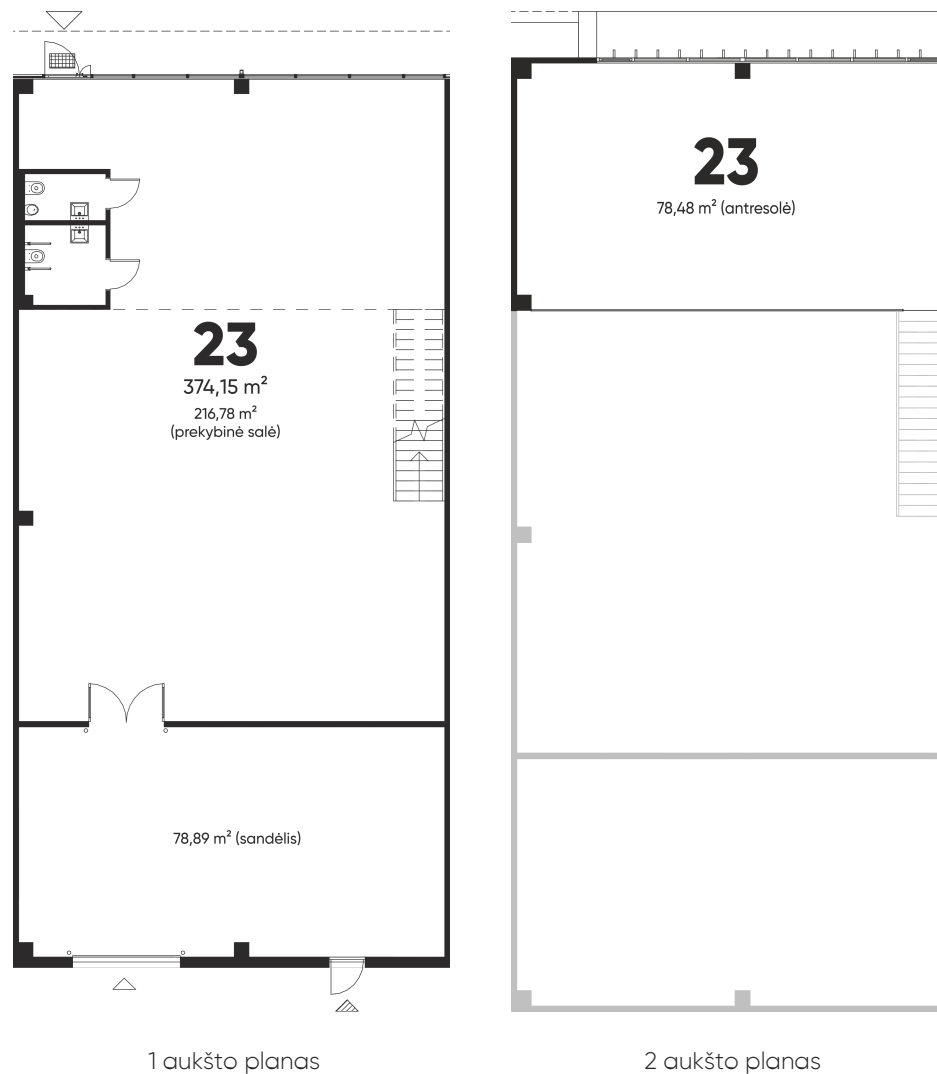
1 aukšto planas