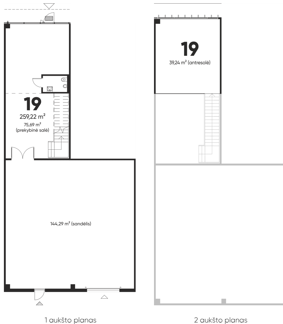
1 aukšto planas