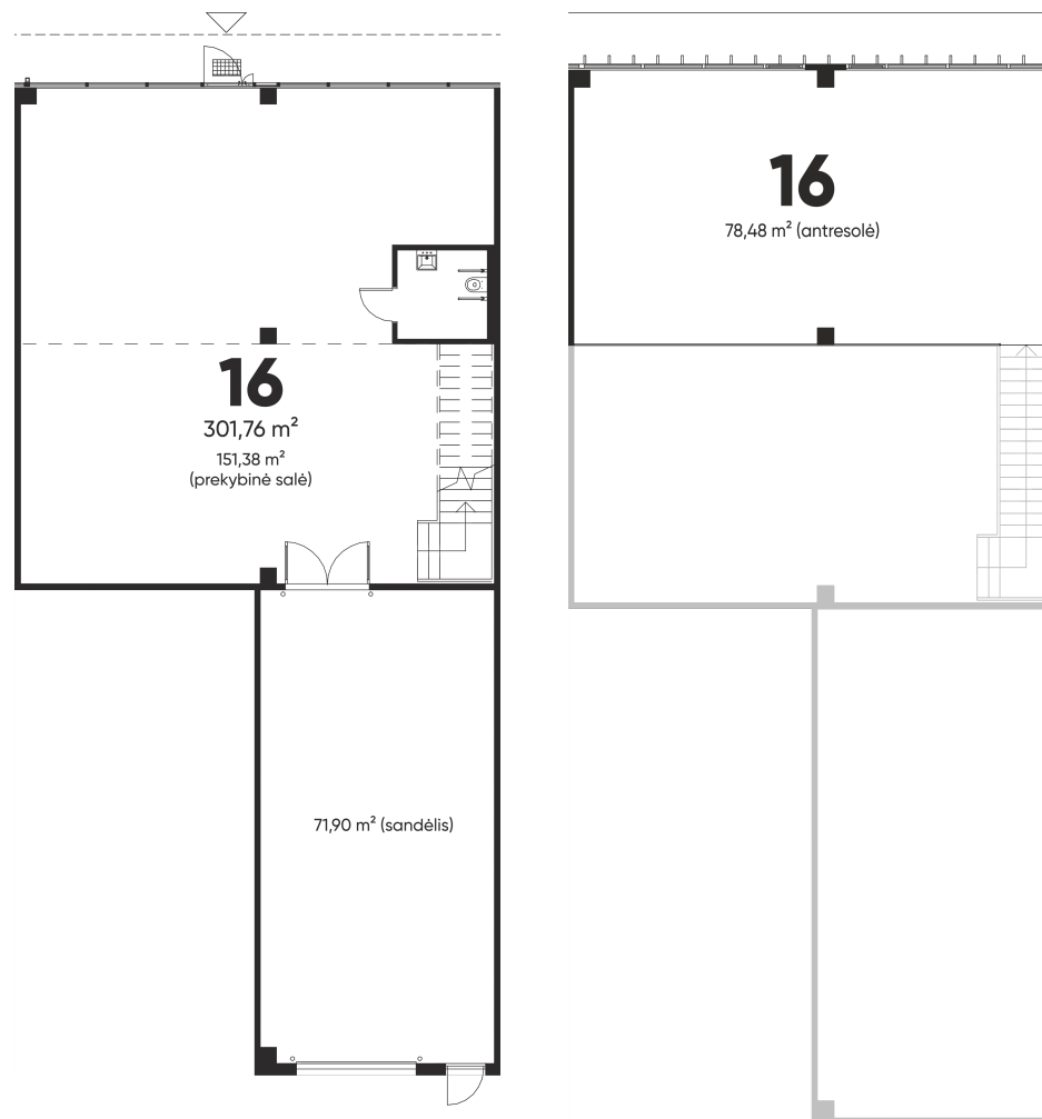
1 aukšto planas