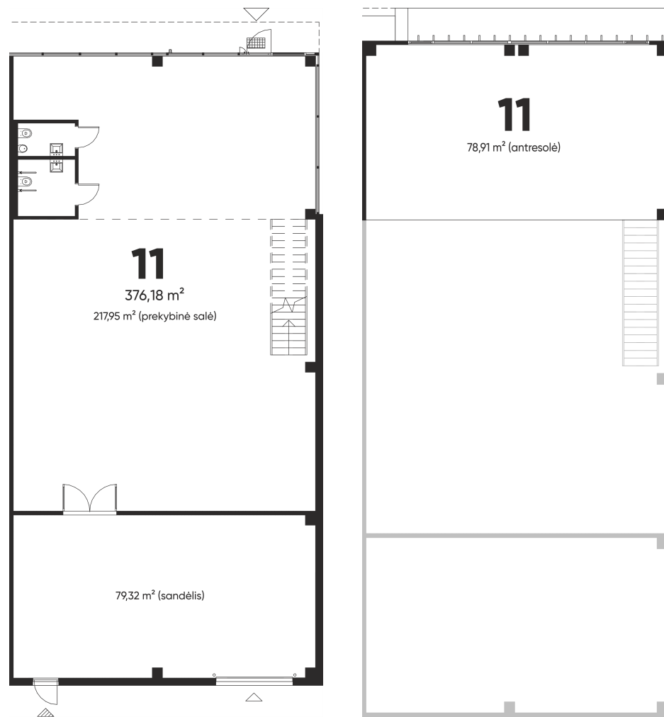
1 aukšto planas